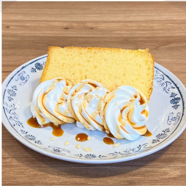
キャラメルソース