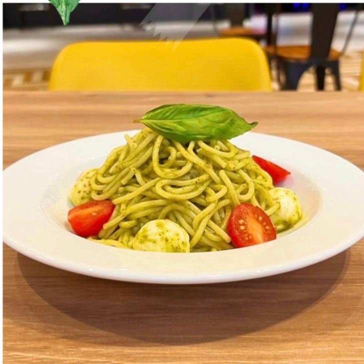
ジェノベーゼ ¥ 950