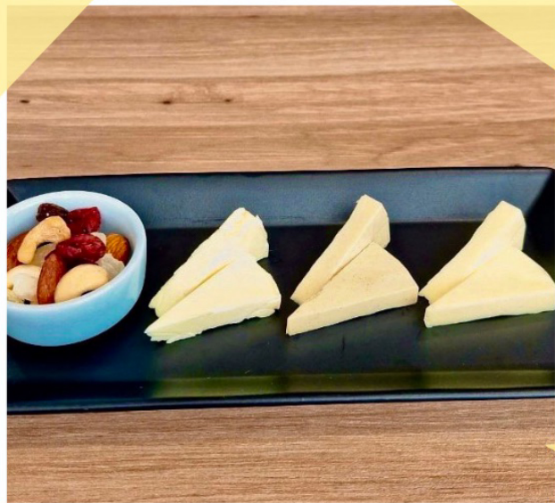
チーズ盛り合わせ ¥ 440