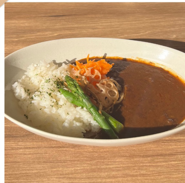
バターチキンカレー ¥ 990