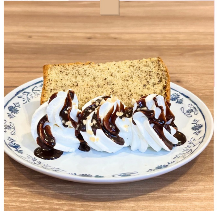
チョコレートソース