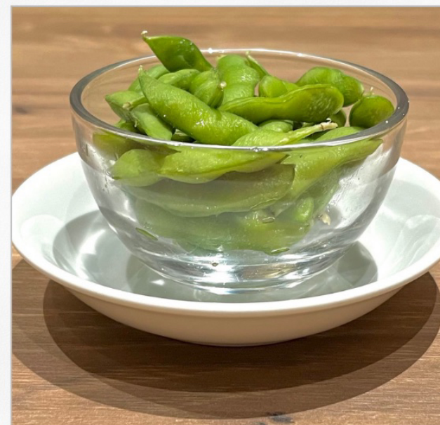
枝豆 ¥ 275