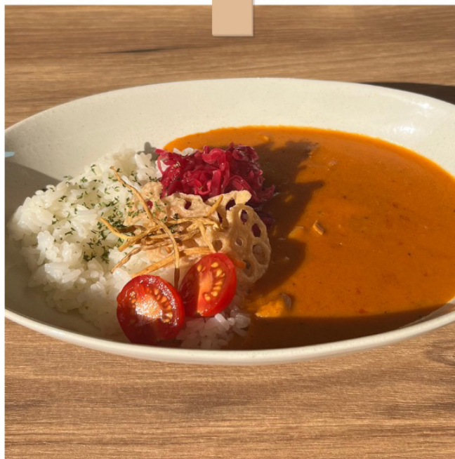
ほぐし牛肉のビーフカレー ¥ 990